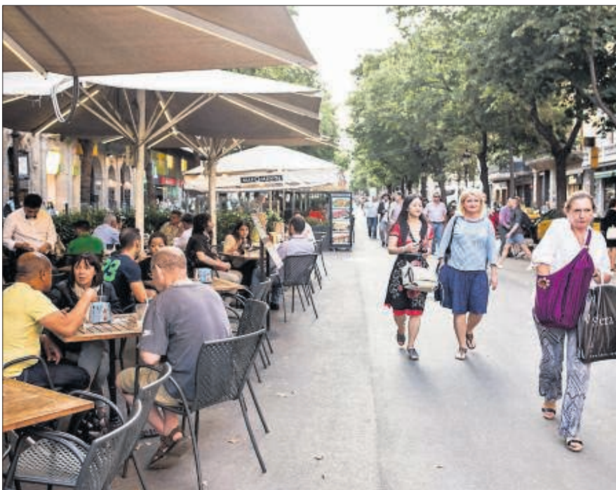
Terrazas, en Rambla Catalunya.