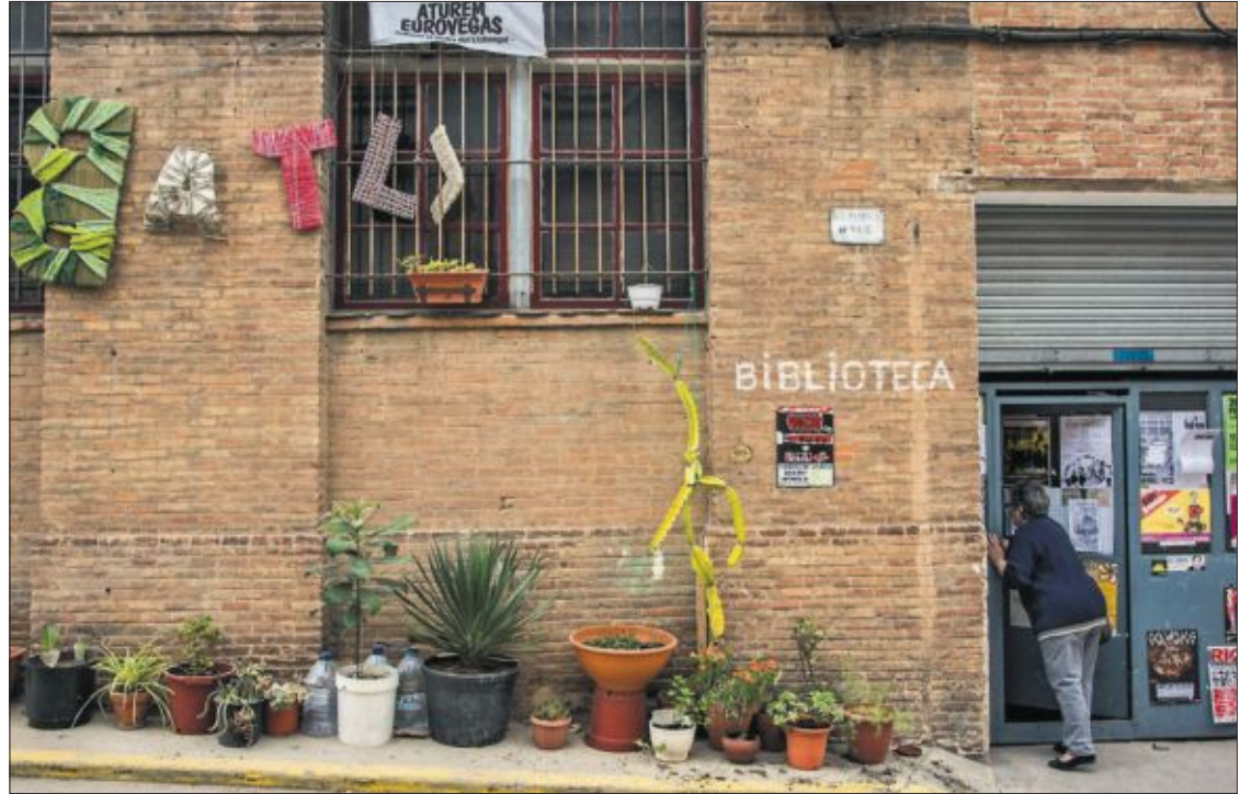
Entrada de la biblioteca de Can Batlló, el recinto recuperado por los vecinos de Sants.

La cita anual de Arquitecturas Colectivas se produce "en un momento dulce para los movimientos sociales de la ciudad", reconoce Vitòria. Unas semanas después del desalojo del centro social ocupado Can Vies y de que las movilizaciones posteriores hicieran dar marcha atrás al Ayuntamiento. Y justo después de la presentación pública de Guanyem, el embrión de una candidatura a las elecciones municipales que apuesta por la política hecha desde abajo. Además,